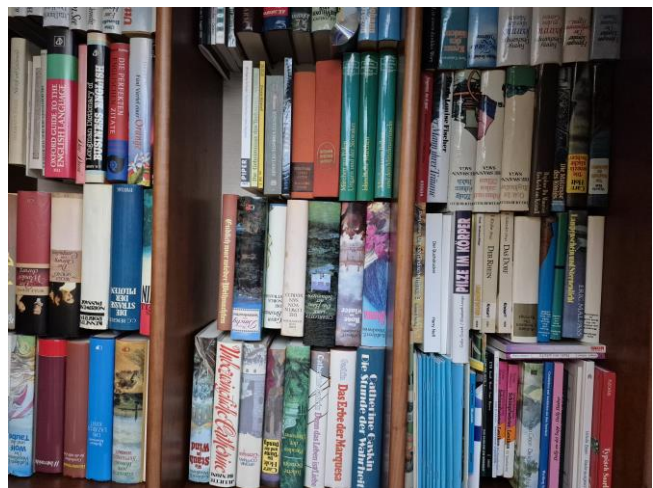
Wie dieser Blick in eine private Bibliothek zeigt, sind Druck-erzeugnisse heute für jedermann erschwinglich und massenhaft erhältlich.

Zum Thema Druck gäbe es noch vieles zu sagen, vor allem, dass der Digitaldruck der Vervielfältigung weitere Chancen bietet und dadurch geringere Auflagen zu günstigen Preisen möglich sind. Oder, dass einer der größten Druckmaschinenhersteller weltweit, die Firma Heidelberger Druckmaschinen, einen Teil ihrer Wurzeln in der Wittersheimer Mühle Hamm hat – aber das ist ein Thema, das an anderer Stelle behandelt werden könnte.