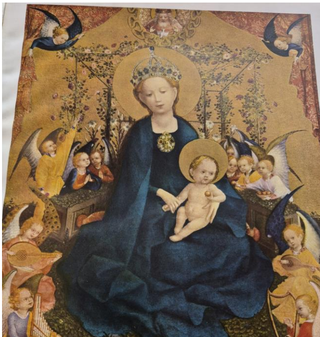
Aus einem Werbebuch der Druckindustrie aus dem Jahr 1934: ein Bild der Madonna mit Kind, aufwändig mit Gold gedruckt

Im Laufe der Jahrhunderte wurde der Druck immer mehr verbessert, es wurden neue Druckverfahren erfunden und eingeführt. Heute werden nicht nur Bücher, Zeitschriften und Zeitungen gedruckt, auch Verpackungen, Kunststoffteile, Geschirr, Werbeartikel usw. usw.