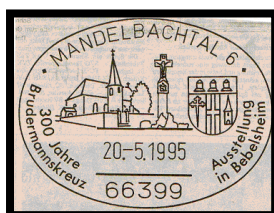
Fotos rechts: Lichterprozession und Sonderstempel der Deutschen Post AG "300 Jahre Brudermannskreuz"

und mehr als 600 Abonnenten erreicht. Auch Nicht-Mitglieder können sie kostenlos über email anfordern.