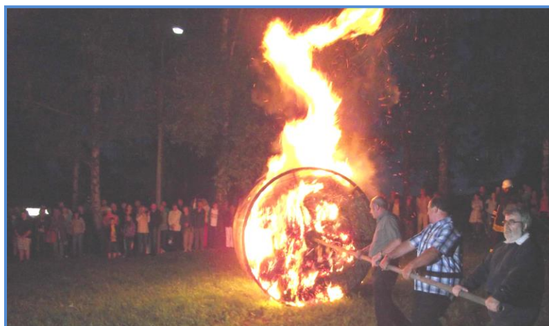
Sonnwendfeier mit dem großen - Feuerrad und Vortrag der "Vier Jahreszeiten"